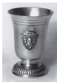
Kleiner Rothenthurmer Becher 300m