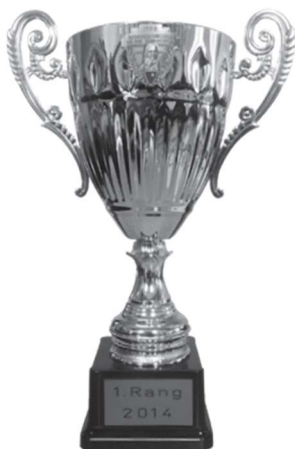
Rothenthurmer Becher 300m