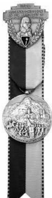
EINZELAUSZEICHNUNG: Kranz oder Kranzkarte